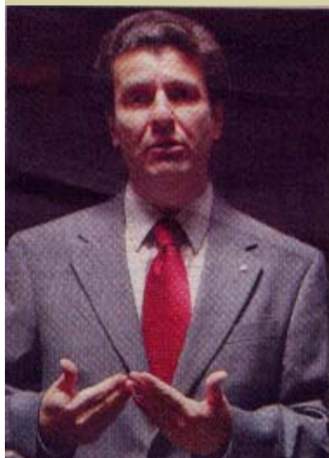
Jorge Méndez Herbruger, presidente del Congreso.

El presidente del Congreso indicó que esta información fue sacada del Congreso por gente que le tiene "envidia" y "que todo lo quieren ver malo".