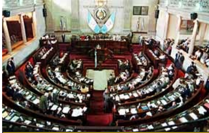
La mayoría de auxiliares administrativos sirve a diputados de la Gran Alianza Nacional (GANAN) y el Partido de Avanzada Nacional (PAN). En menor número, a los del Frente Republicano Guatemalteco (FRG) y algunos a los de la Unidad Nacional de la Esperanza (UNE).

La mayoría de auxiliares administrativos sirve a diputados de la Gran Alianza Nacional