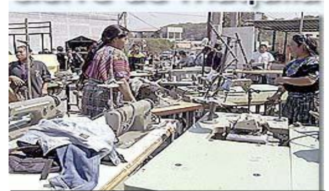
Trabajadoras de las maquilas han sido explotadas por los dueños no les pagan ningún tipo de prestación. La trabajadora o trabajador, saben que pasados 30 o 35 años de laborar a través de este tipo de mecanismos, no se contará con jubilación o algún tipo de indemnización.

Cuando nos trasladamos a algunas áreas geográficas como la costa sur o las comunidades periféricas a las grandes fincas, nos encontramos