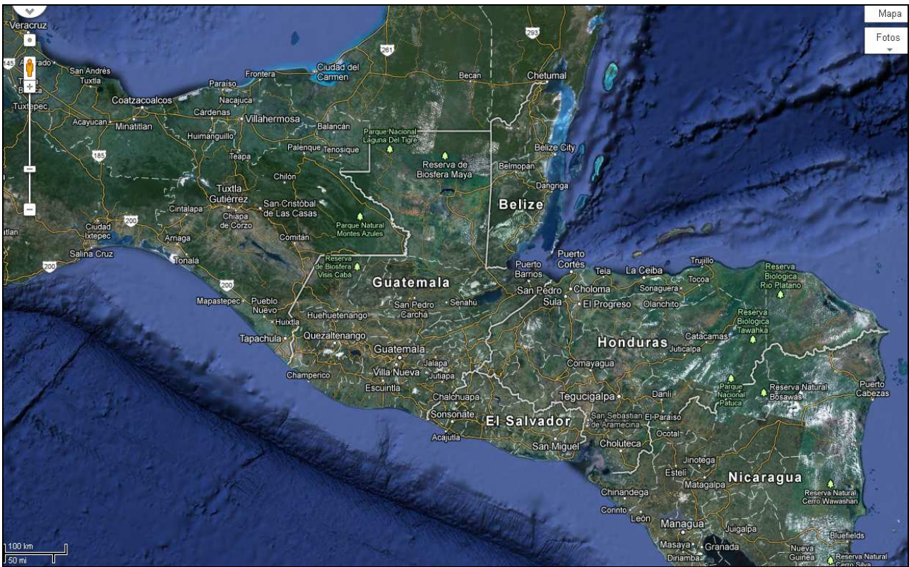
Mapa No. 1 Regional

Sur de México, Guatemala, Belice, El Salvador, Honduras y Nicaragua