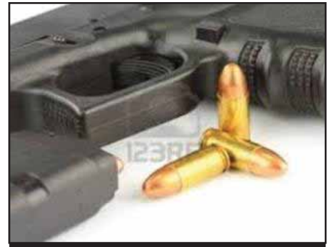
GUATEMALA.- El Militarismo Patriota