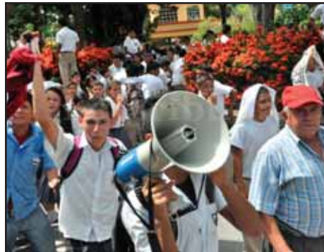
HONDURAS.- Todos a luchar contra efectos de Ley de Educación