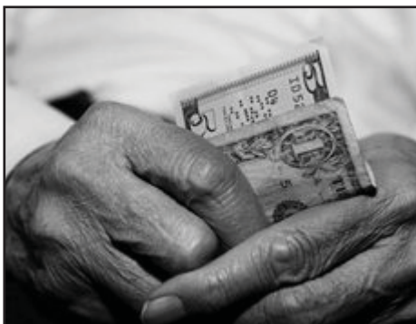
EL SALVADOR.- FMI y Gobierno del Cambio" atacan pesiones

EL CASO SNOWDEN: ESPIONAJE PLANETARIO Y OCASO DEL DERECHO DE ASILO