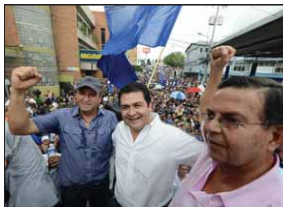
El Partido Nacional se muestra unido en la lucha por preservar el poder