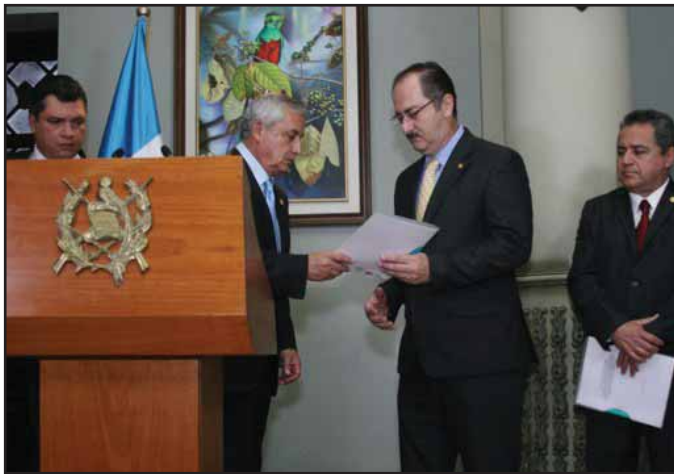
Pérez Molina entrega al presidente del Congreso, la iniciativa de amnistía fiscal

Llamamos a los compañeros trabajadores, campesinos y pueblo en general a estar alerta para impedir que el gobierno rebaje el poco gasto que realiza en salud, educación, y gasto social en general. Para solucionar el déficit fiscal el gobierno debe eliminar las exoneraciones y privilegios fiscales que otorga a los empresarios nacionales y extranjeros, aumentar los impuestos directos sobre las ganancias de las empresas. La crisis no la debe pagar el pueblo, la deben pagar los capitalistas. ■