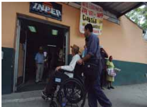
EL SALVADOR.- Renacionalizar el sistema de pensiones