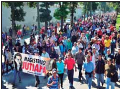
GUATEMALA.- Por la defensa de los derechos de los trabajadores estatales

FRACASA EL PACTO DE SAN JOSÉ, NO SE LOGRA LA REUNIFICACIÓN DE CENTROAMÉRICA