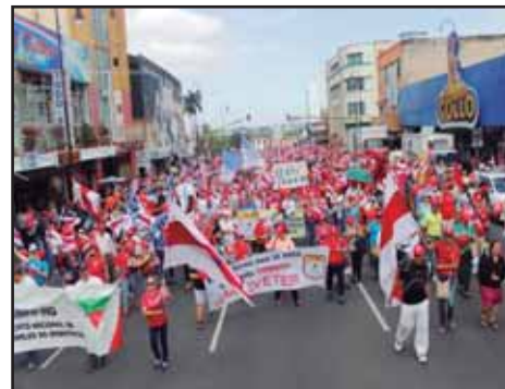
COSTA RICA.- Unidad sindical magisterial para negociar convenio