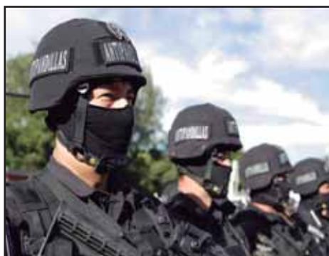
EL SALVADOR.- El gobierno del FMLN apuesta todo a plan de seguridad