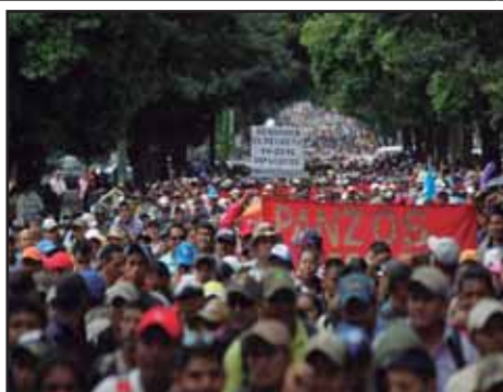
GUATEMALA.- Lucha del Magisterio hace retroceder al Congreso