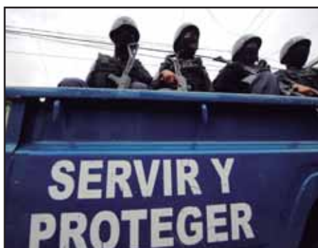
HONDURAS.- Disolver la corrupta Policía Nacional y crear Autodefensas

GUATEMALA.- ARTICULAR UN NUEVO MOVIMIENTO ESTUDIANTIL