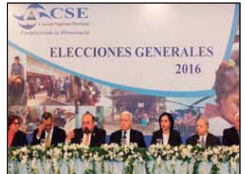
NICARAGUA.- Factores a favor y en contra de la reelección de Daniel Ortega