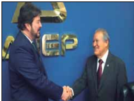
EL SALVADOR.- EL FMLN busca desesperadamente consensos con ANEP