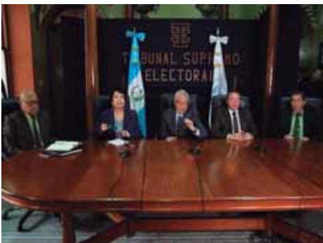
GUATEMALA.- Compas de espera con las Reformas Electorales

COSTA RICA.- * !Abajo el proyecto de Ley No 19,923!! * Los desafíos de OPY