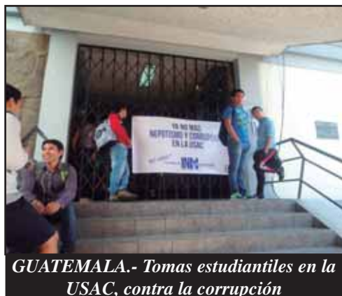
GUATEMALA.- Tomas estudiantiles en la USAC, contra la corrupción