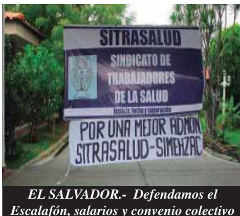
EL SALVADOR.- Defendamos el Escalafón, salarios y convenio colectivo