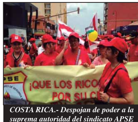
COSTA RICA.- Despojan de poder a la suprema autoridad del sindicato APSE