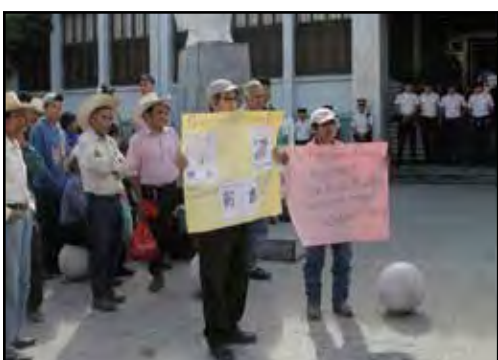
GUATEMALA. Por el respeto a la decisión de las comunidades

VENEZUELA: LA TRANSICIÓN HA COMENZADO CON EL FORCEJEO POR LA CONSTITUCIÓN DE 1999