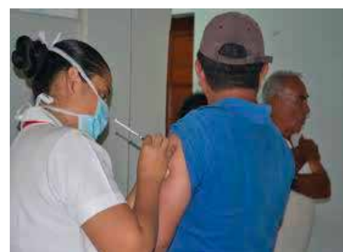
EL SALVADOR.- IRAS deja al descubierto deficiencias en sistema de salud