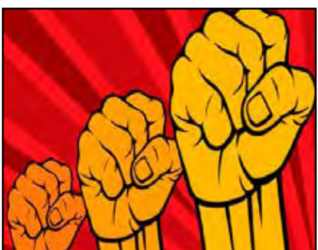
NICARAGUA.- A 45 años de las huelgas contra la jornada de 60 horas