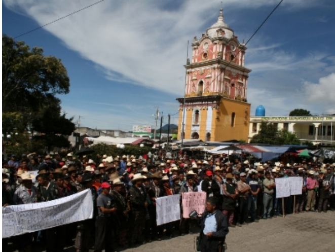
Manifestación pacífica se llevó a cabo en cabecera departamental de Sololá.