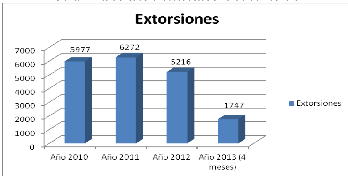
Grafica 2. Extorsiones denunciadas desde el 2010 a abril de 2013