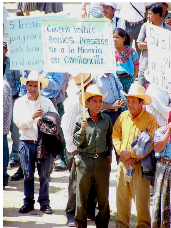
Images from Comitancillo, 14 th of May 2008

Two days later, the people of Tacaná , a large village in San Marcos close to the Mexican border, also showed their opposition to mining operations in their territory. After requests of the communal authorities and local leaders, the new-elected mayor convoked a manifestation on the 16 th of May in which, according to our estimate, some 25.000 people participated. What was so special about this demonstration in Tacaná was the active participation of local college students, which walked around swinging their banners that summoned more respect for life and nature, as well as rejecting mining company Montana Exploradora de Guatemala S.A. Furthermore it was interesting to see that the mayors of Ixchiguán, San José Ojetenam, Sibinal, Comitancillo, Tajumulco (all villages in San Marcos) and Tectitán (in the Huehuetenango department) were also present, and all of them congratulated the people of Tacaná for their presence at the demonstration and their opposition against mining operations.