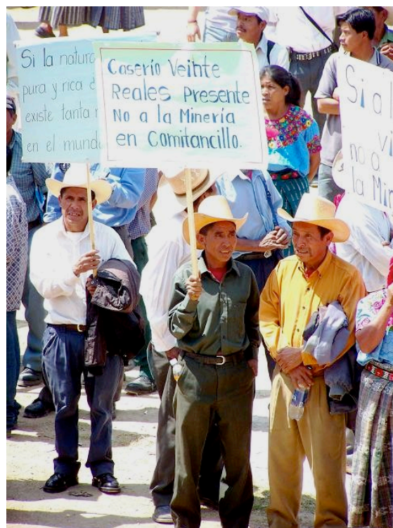
Imágenes de Comitancillo, 14 de mayo de 2008

Dos días más tarde, el pueblo de Tacaná , en la frontera con México, también demostró su rechazo a las operaciones mineras en su territorio; a petición de las autoridades comunitarias y diferentes líderes, el alcalde convocó a una manifestación para el día 16 de mayo, en que, según nuestra estimación, participaron unas 25.000 personas. En Tacaná se destacó la activa participación de los estudiantes de los diferentes colegios, quienes portaron pancartas en las que llamaron al respeto por la vida y la naturaleza, así como al rechazo a la empresa minera Montana Exploradora de Guatemala S.A. También fue notable durante esta manifestación la presencia de los alcaldes municipales de Ixchiguán, San José Ojetenam, Sibinal, Comitancillo, Tajumulco y Tectitán, los cuales felicitaron a los vecinos de Tacaná por su presencia y su postura en contra de las operaciones mineras.