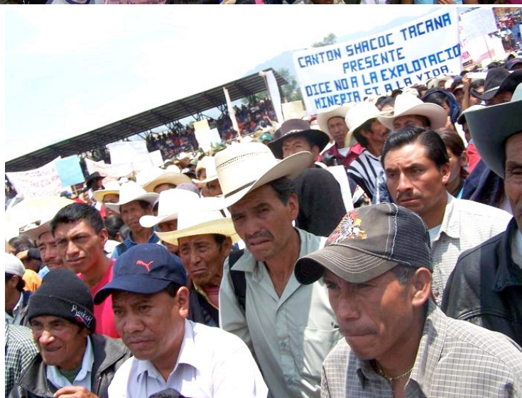
Cuatro imágenes de la manifestación en Tacaná en contra de la minería metálica, 16 de mayo de 2008. Abajo, a la izquierda, el alcalde de Tacaná.

Mientras los pueblos del altiplano occidental se están aliando cada día más para formar un frente contra la expansión de la minería metálica, unos miles de kilómetros al norte, en Canadá, Goldcorp presentó su nuevo Informe Anual sobre el año 2007. En este informe, uno puede enterarse que las ganancias netas de la mina Marlin (en los municipios de San Miguel Ixtahuacán y Sipacapa) para el año 2007 aumentaron a la cifra de $72.8 millones , unos 550 millones de Quetzales – exactamente el doble del año anterior. Sin embargo, la ganancia moral ha sido para los pueblos indígenas de San Marcos y Huehuetenango, quienes han iniciado su camino pacífico hacia un futuro sin saqueo de sus recursos y a favor de la protección de su tierra.