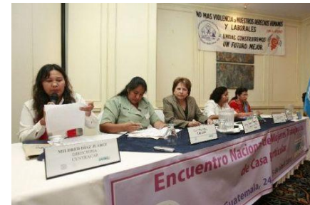
Trabajadoras en reclamo de reformas al Código de Trabajo

En beneficio de miles de trabajadoras y trabajadores de casa particular